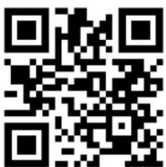
Circulaire de rentrée 2026

Derrière les promesses institutionnelles de simplification, la FSU-SNUipp alerte : une surcharge de travail, une logique de contrôle plutôt que de moyens (places en structures spécialisées, AESH...).